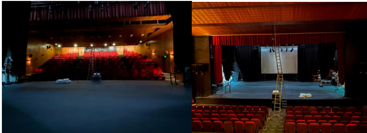
Imágenes desde y hacia el escenario de la Sala Teatro Serrano